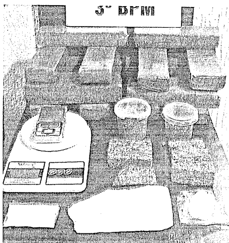
A Polícia chegou até a droga graças a denúncias pelo 181.

Da assessoria e JdeB - No início da noite de terça-feira, 31, após denúncias via telefone 181, a equipe da Ronda Ostensiva com Apoio de Motocicletas (Rocam) foi até o Bairro Vila Esperança, em Pato Branco. Na residência indicada, es-